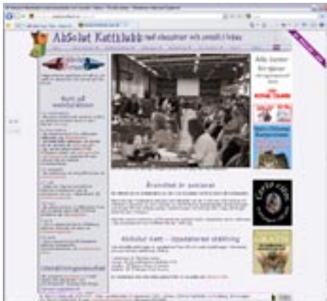
Den nya webbplatsens första sida.

Mycket av innehållet på den gamla webbplatsen har återanvänts på den nya och innehållsmässigt är det ingen stor skillnad.