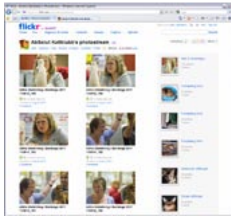
AbSolut Kattklubbs sida på Flickr. ( http://www.flickr.com/photos/absolutkattklubb/ )

Vi har installerat ett fotogalleri, som i sig krävde att vi flyttade vår webbplats på vårt webshotell, från en server med programvara från Microsoft till en server som kör Unix. Vi har också skaffat ett konto på fotositen Flickr, som ett alternativ till att ha ett eget fotogalleri. Vi har kommit fram till att Flickr är ett bättre alternativ och vi kommer alltså att ta bort vårt eget fotogalleri.