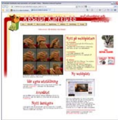
Bilden visar hur webbplatsens första sida såg ut innan vi gjorde om den.

Mycket av innehållet på den gamla webbplatsen har återanvänts på den nya och innehållsmässigt är det ingen stor skillnad.